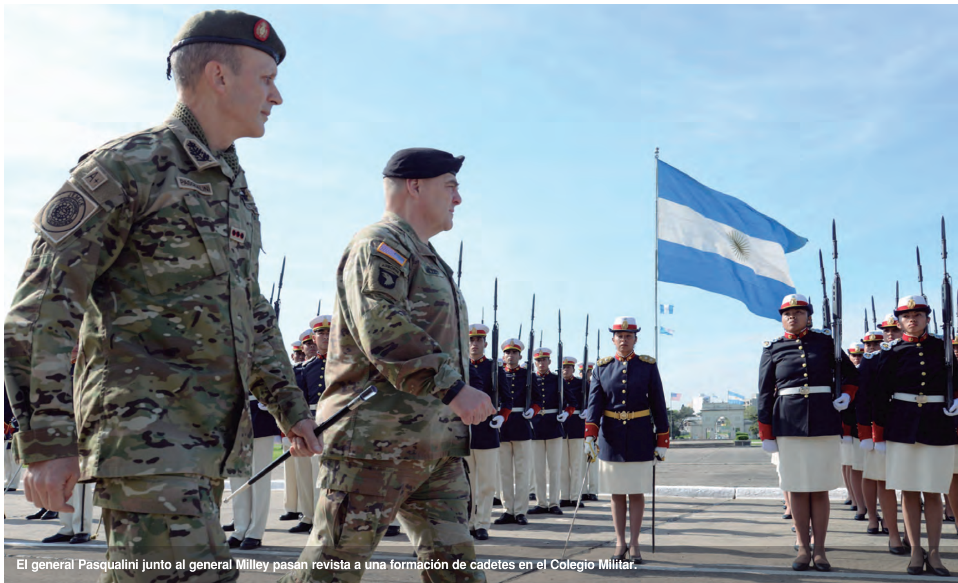
El general Pasqualini junto al general Milley pasan revista a una formación de cadetes en el Colegio Militar.

El Ejército Argentino recibió la visita del jefe de Estado Mayor del Ejército de los Estados Unidos de América, general Mark Alexander Milley al Colegio Militar de la Nación para afianzar las relaciones entre ambas Fuerzas.