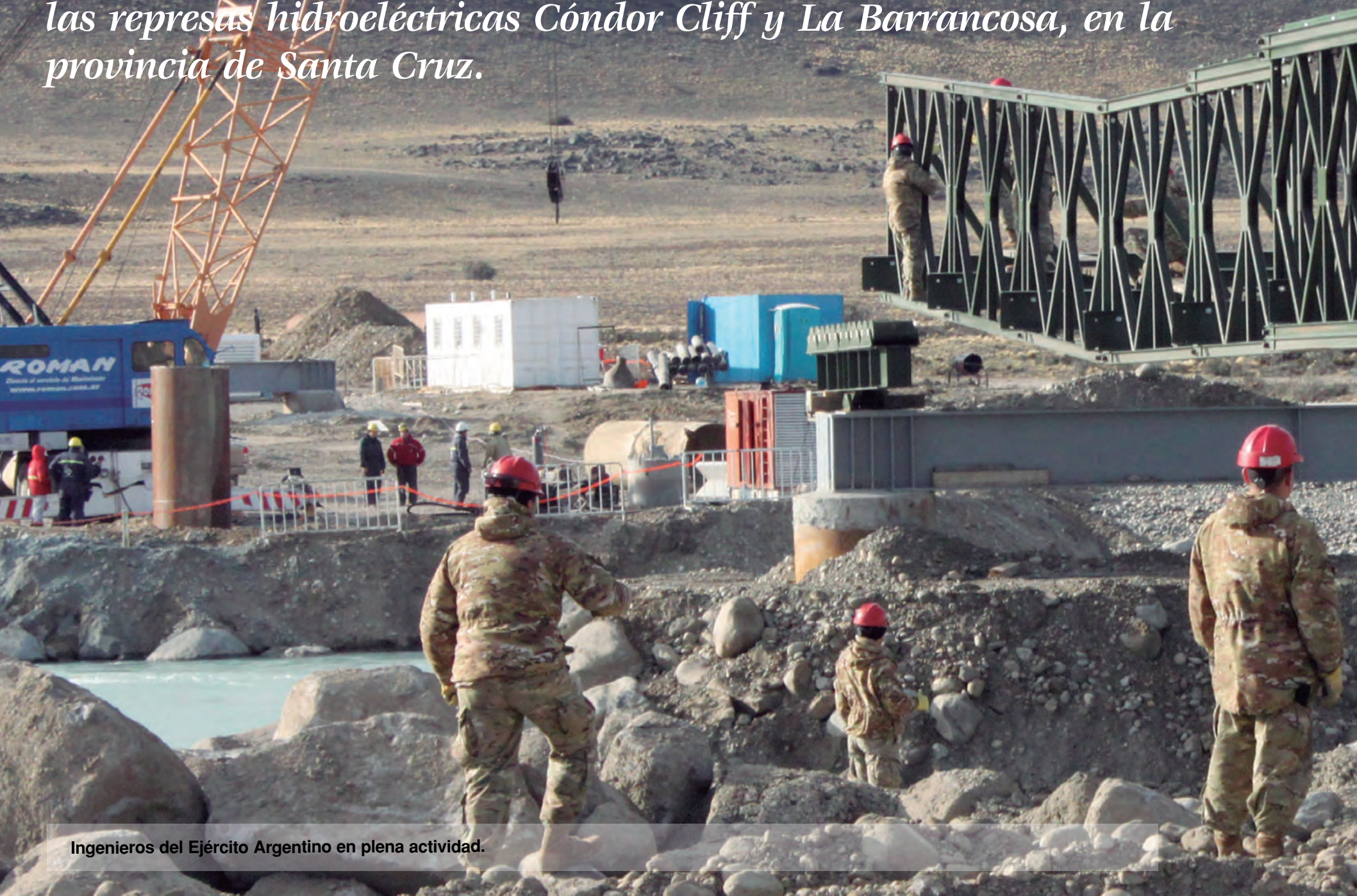
Ingenieros del Ejército Argentino en plena actividad.

Desde marzo de 2018, el Ejército Argentino brinda apoyo a la construcción de dos importantes obras de infraestructura nacional: las represas hidroeléctricas Cóndor Cliff y La Barrancosa, en la provincia de Santa Cruz.