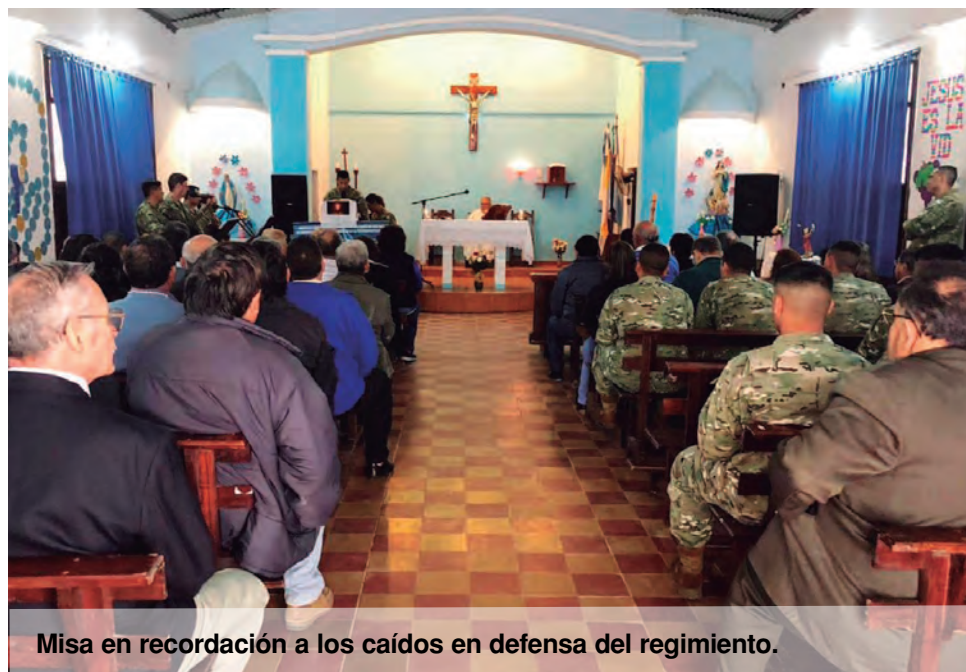
Misa en recordación a los caídos en defensa del regimiento.