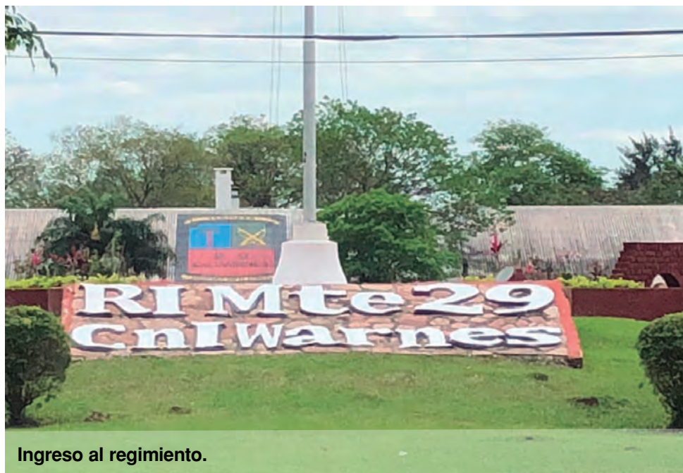
Ingreso al regimiento.