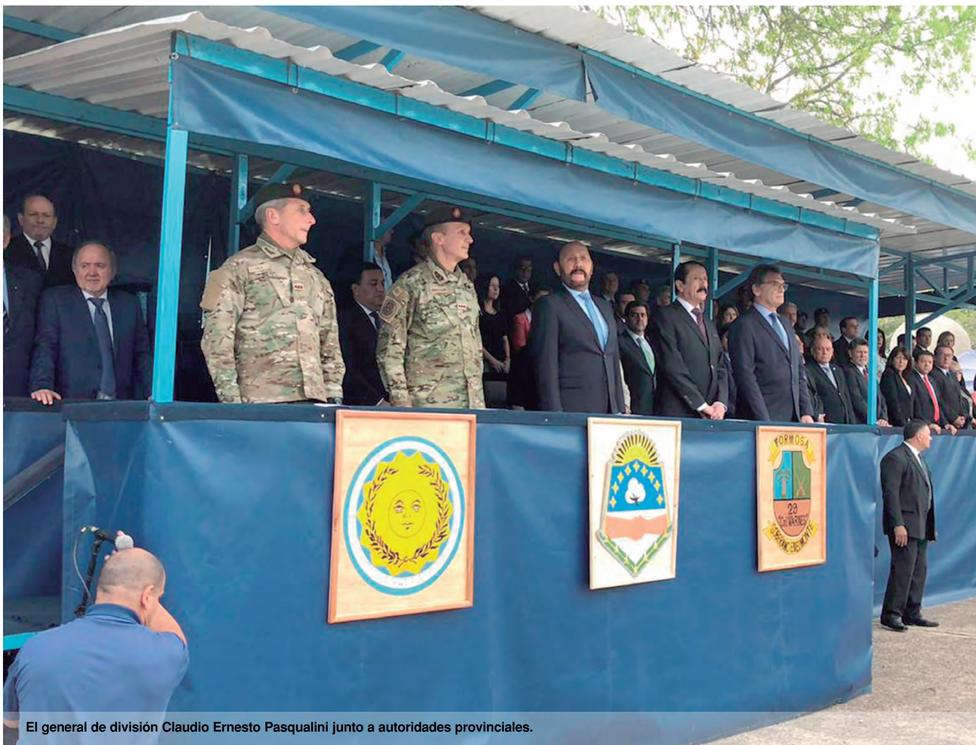
El general de división Claudio Ernesto Pasqualini junto a autoridades provinciales.