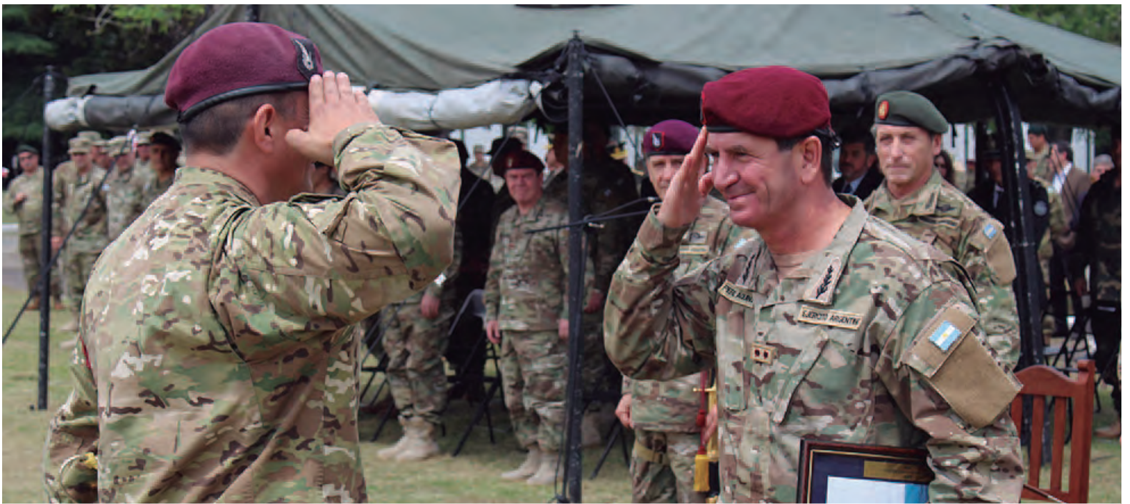
El general Pérez Aquino recibe un reconocimiento por su paso en la Fuerza de Despliegue Rápido.