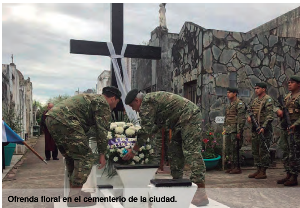
Ofrenda floral en el cementerio de la ciudad.